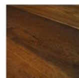
RAME (TIPO ALACEITE)