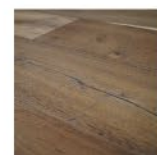
BISCOTTO (TIPO ALACEITE)